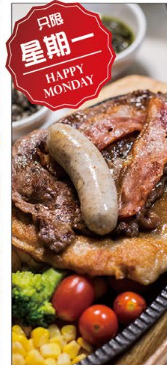
星期一雜扒餐 Mixed Grilled on Monday