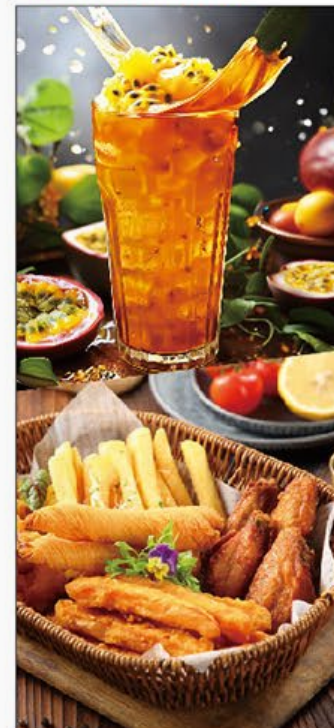
夏日特飲及休閒小食推廣 Summer Drinks & Snacks Promotion