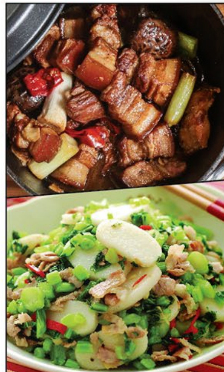
蘇杭美食匯聚 Hangzhou Delicacies Delight