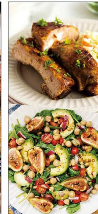
鮮果美食推介 Fresh Fruits Recommendations