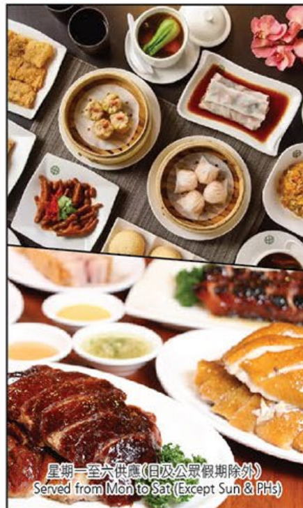
早/午茶市全單85折 15% off Morning Tea & Lunch 星期一至六供應(日及公眾假期除外) Served from Mon to Sat (Except Sun & PHs)