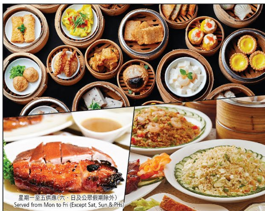
中式美食點心薈萃放題 Lunch All-You-Can-Eat 星期一至五供應(六、日及公眾假期除外) Served from Mon to Fri (Except Sat, Sun & PHs)