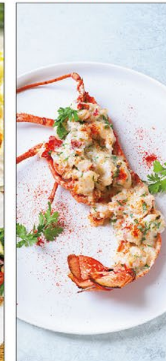
龍蝦米多推介 Lobster Thermidor Recommendations