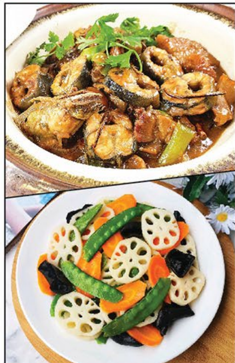
中山風味篇 Zhongshan Delicacies Delight